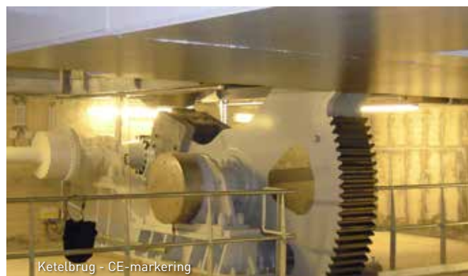
Ketelbrug - CE-markering