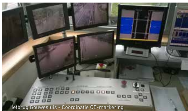
Hefbrug Gouwesluis - Coördinatie CE-markering